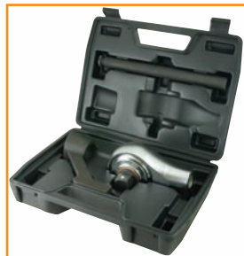
Inclut le boîtier moulé