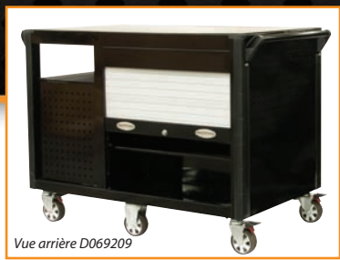
Vue arrière D069209