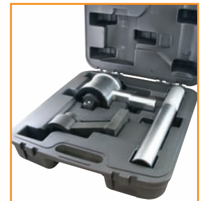
Inclut le boîtier moulé